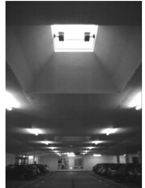
viel tageslicht durch große deckenöffnungen