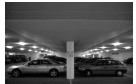
übersichtlichkeit durch weite stützenabstände